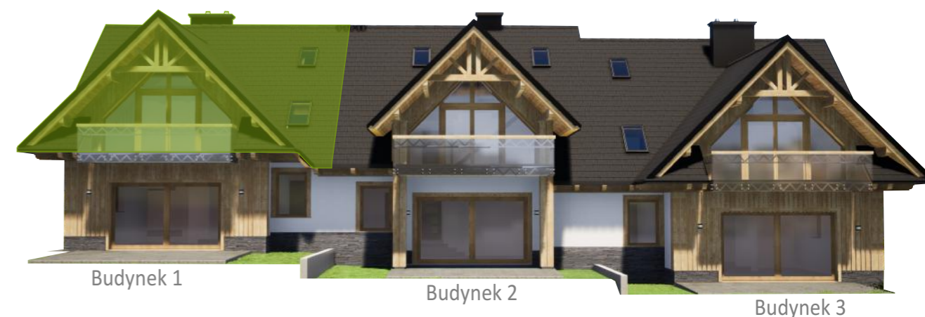
Widok od tyłu

* Powierzchnia netto liczona zgodnie z normą PN-ISO 9836:1997 ( po powierzchni podłóg do wysokości pom: od 0-1,4m - 0%, od 1,4-2,2m - 50% i powyżej 2,2m - 100% )