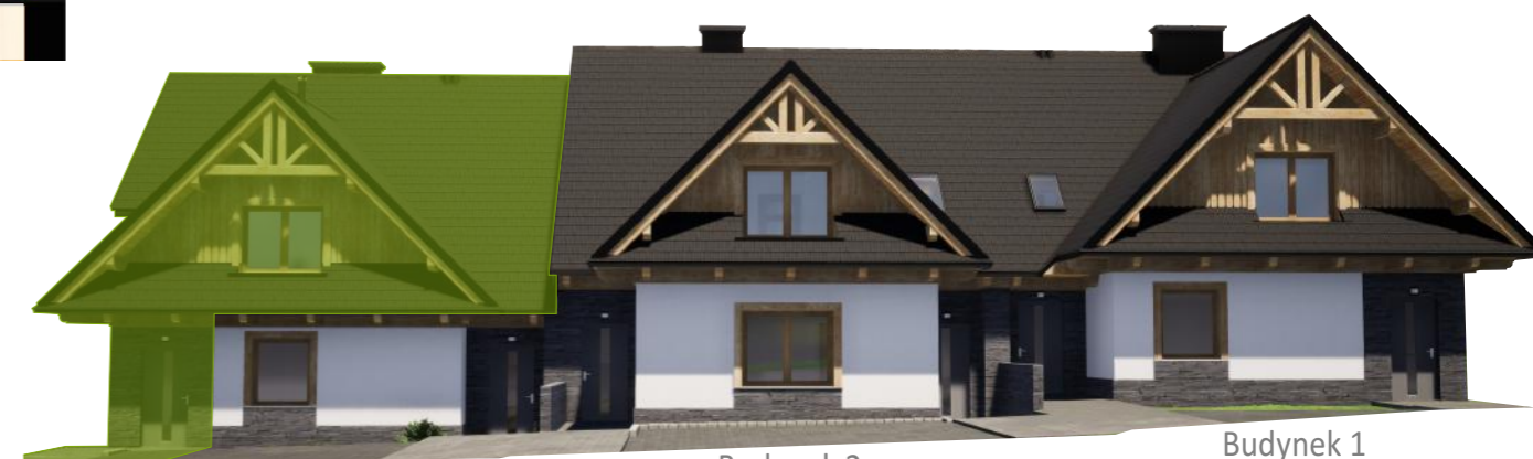
Widok od frontu