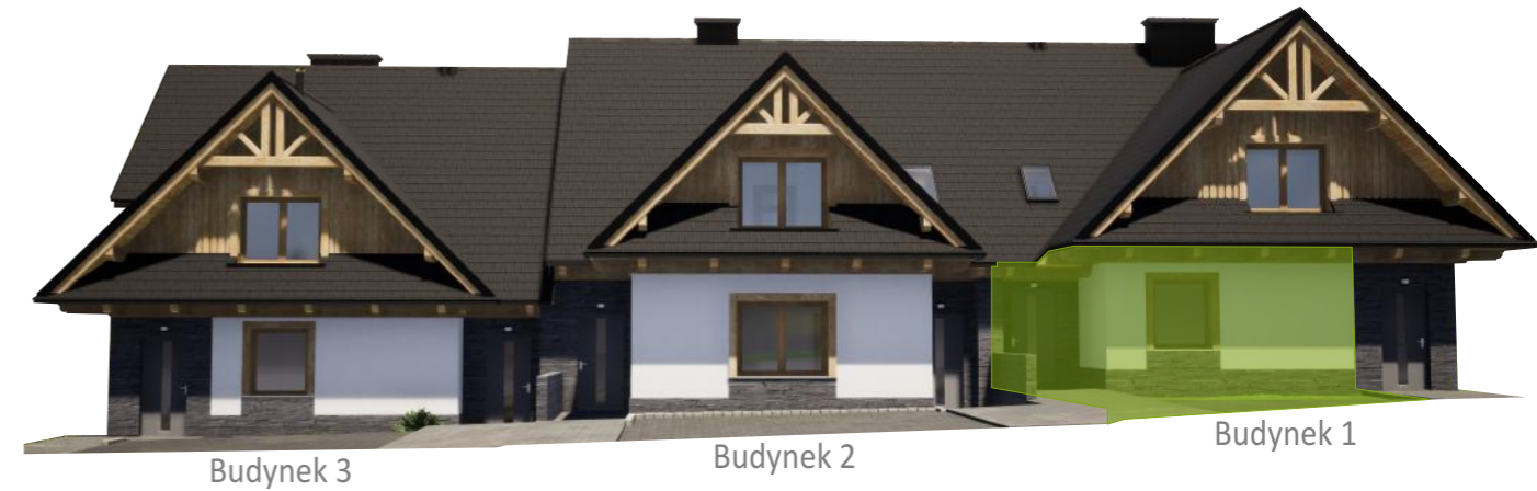
Widok od frontu