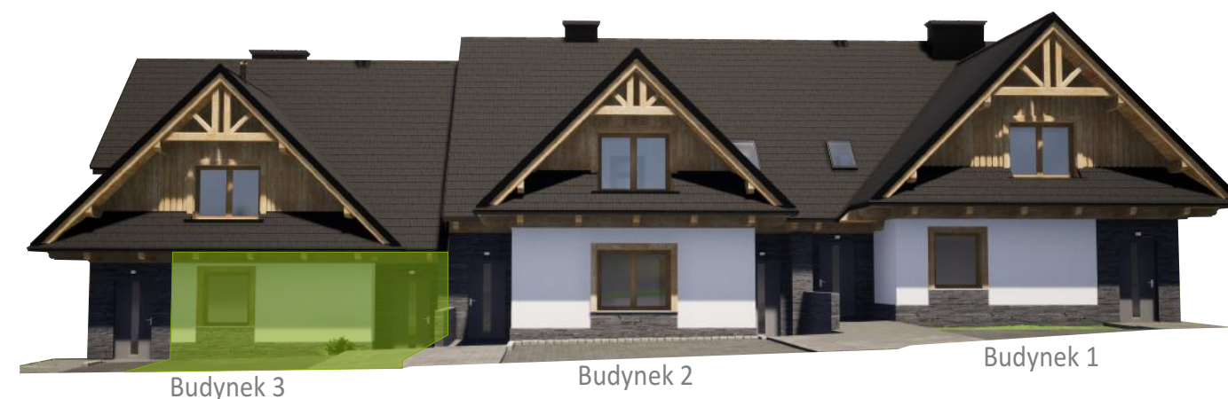
Widok od frontu