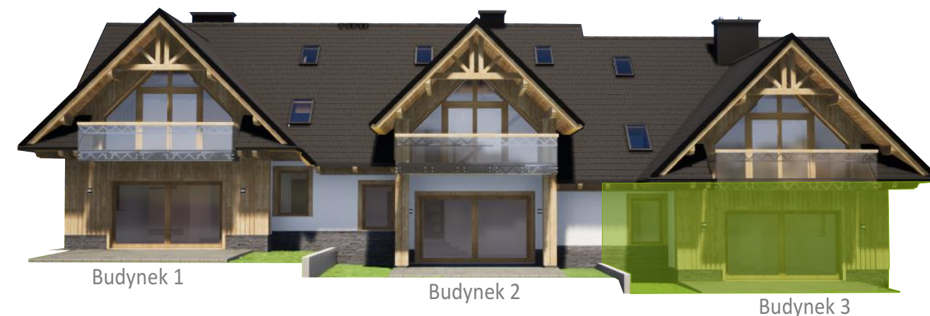
Widok od tyłu

* Powierzchnia netto liczona zgodnie z normą PN-ISO 9836:1997 ( po powierzchni podłóg do wysokości pom: od 0-1,4m - 0%, od 1,4-2,2m - 50% i powyżej 2,2m - 100% )