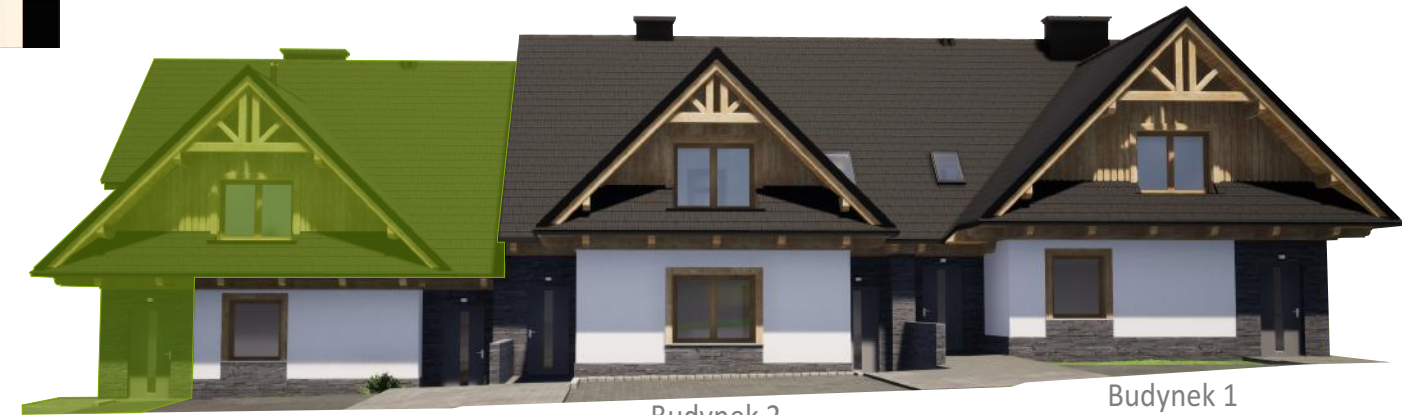
Widok od frontu