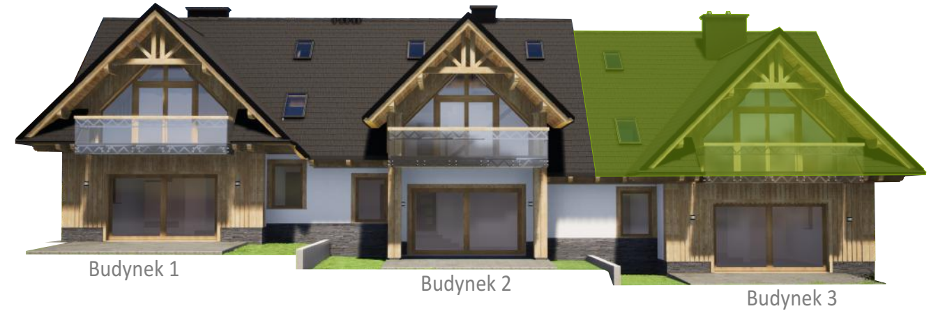
Widok od tyłu

* Powierzchnia netto liczona zgodnie z normą PN-ISO 9836:1997 ( po powierzchni podłóg do wysokości pom: od 0-1,4m - 0%, od 1,4-2,2m - 50% i powyżej 2,2m - 100% )