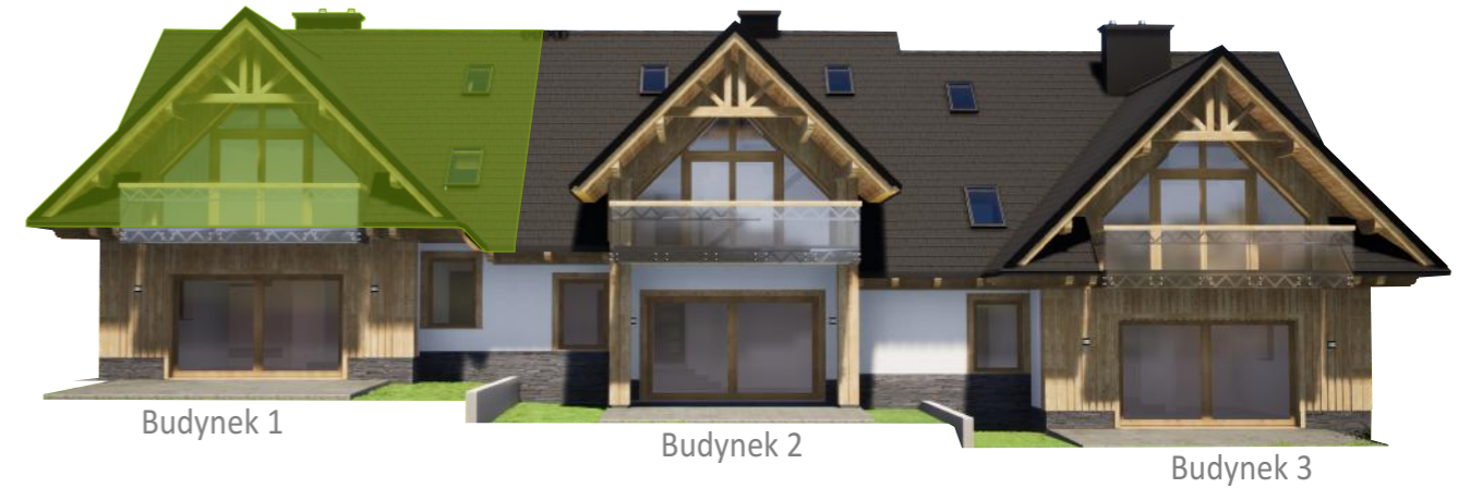
Widok od tyłu

* Powierzchnia netto liczona zgodnie z normą PN-ISO 9836:1997 ( po powierzchni podłóg do wysokości pom: od 0-1,4m - 0%, od 1,4-2,2m - 50% i powyżej 2,2m - 100% )