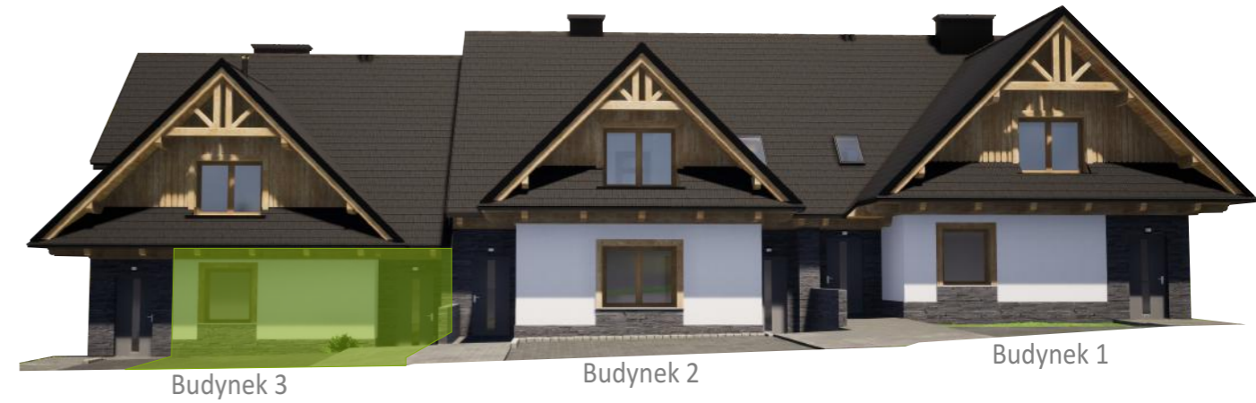
Widok od frontu