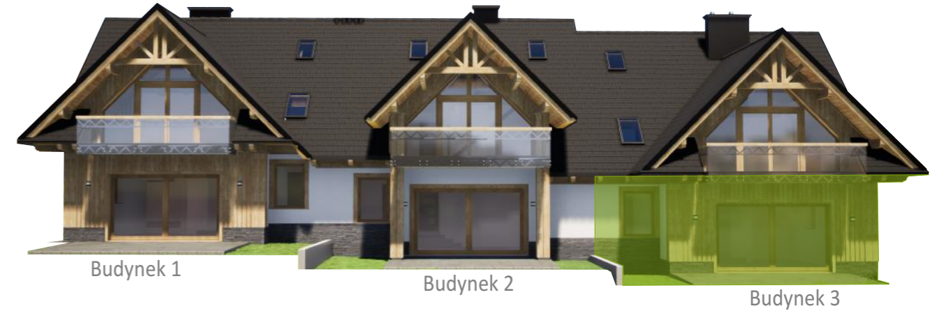
Widok od tyłu